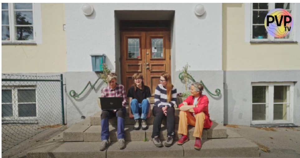
Trailer om På Varje Plats på Skånes Arkivförbunds YouTube.

På Varje Plats är ett skolläromedel framtaget i ett samverkansprojekt mellan de fyra organisationerna Skånes Arkivförbund, Trelleborgs Museer, Regionmuseet Skåne och Skånes hembygdsförbund 2020-2023, med projektmedel från Region Skåne och Kulturrådet.