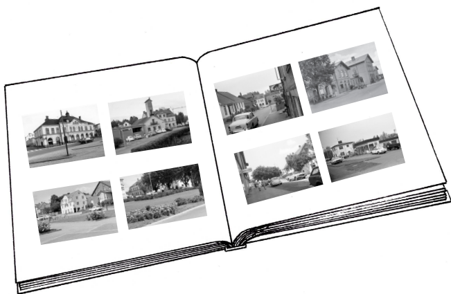
Teckning av ett fotoalbum. Ritad av Johanna Nessow, Skånes Arkivförbund.

Ett annat sätt att jobba med äldre fotografier är att ge eleverna i uppdrag att leta upp platserna utifrån motiven på fotografierna. Eleverna kan få i uppgift att leta upp och fotografera samma plats idag. Då kan ni tillsammans gå igenom varje plats och fotografi och diskutera utifrån frågorna ovan.