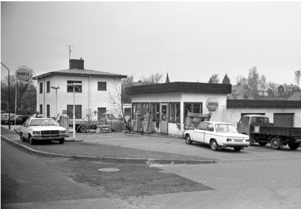
Shellmacken i Höör. Foto: Börje Nilsson, 1950-tal, donerat till Höörs kommunarkiv.

Vid stoppet på Storgatan i Höör tar pedagogerna också upp att många svenska städer har en gata med namnet Storgatan. Dessa gator fungerade i regel som städernas huvudgator. De var hjärtat i affärsverksamheten och huvudled för genomfartstrafiken. Eleverna uppmanas att reflektera över hur och varför gatan har fått sitt namn? Och vilka slags verksamheter och butiker kan ha präglat Storgatan och dess betydelse för stadens centrum? Är det på samma sätt idag?