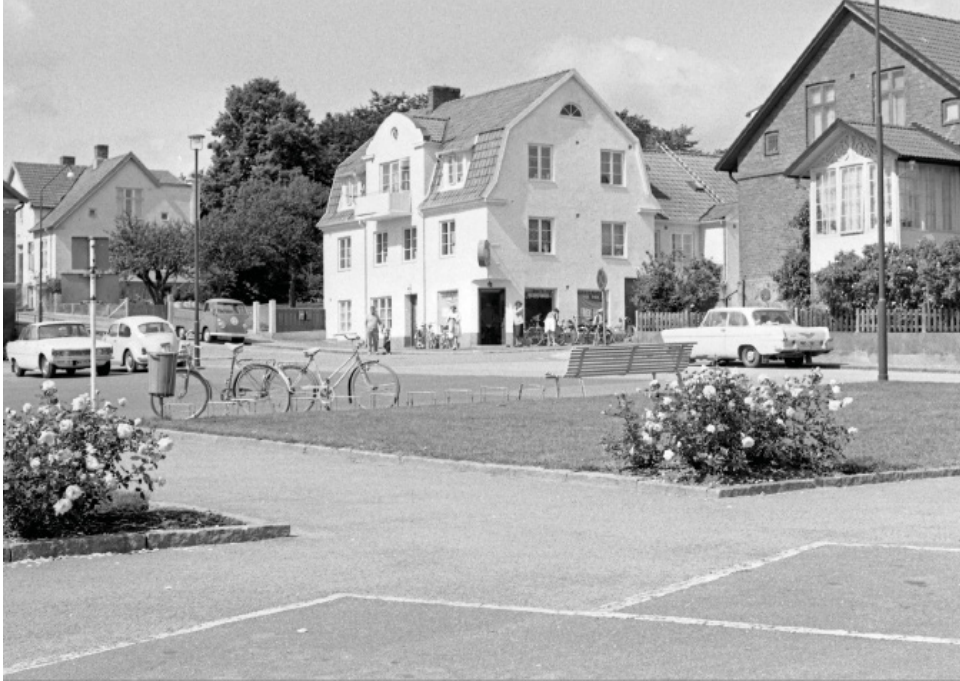
Lilla Torg i Höör. Foto: Börje Nilsson, 1950-tal, donerat till Höörs kommunarkiv.