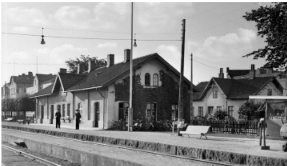
Skurups järnvägsstation cirka 1936.

När järnvägen kom till orten var det en festens dag! Järnvägsstationen invigdes med pompa och ståt. Landshövdingen, kanske till och med kungen, var säkerligen där. Hela samhället var samlat för att fira. Regementets orkester spelade, det åts och dracks och hölls tal.