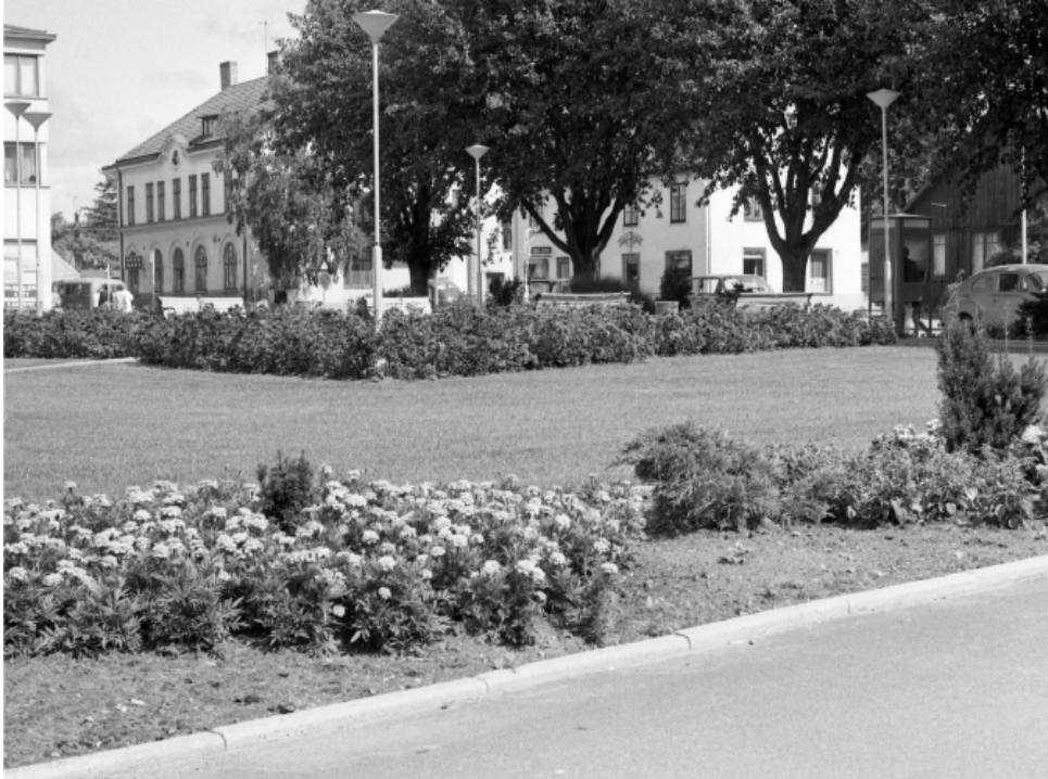
Nya Torg i Höör. Foto: Börje Nilsson, 1950-tal, donerat till Höörs kommunarkiv.