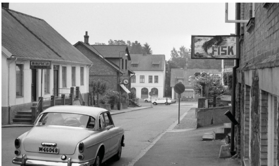
Kungsgatan i Höör. Foto: Börje Nilsson, 1950-tal, donerat till Höörs kommunarkiv.

Det sista stoppet på stadsvandringen var platsen där gamla brandstationen tidigare låg. Med åren blev brandstationen för liten och otillräcklig för att rymma dagens moderna brandbilar, och renovering eller ombyggnad skulle ha varit kostsamt. Istället beslutade man att riva den och bygga 30 nya lägenheter på samma plats. Eleverna fick möjlighet att jämföra platsen idag med det äldre fotografiet och reflektera över hur platsen har förändrats över tid.