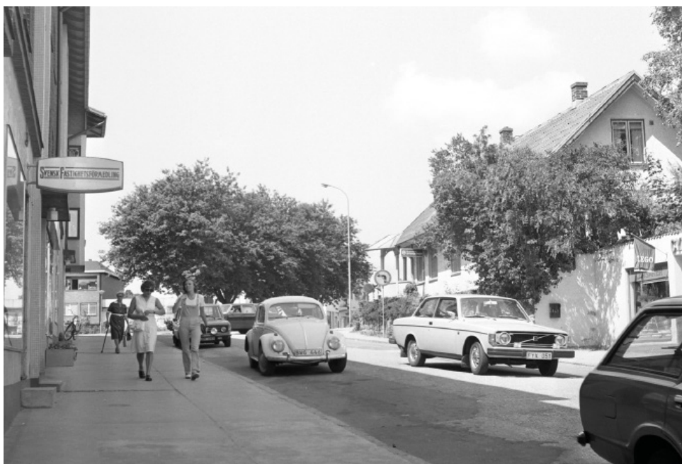
Storgatan i Höör. Foto: Börje Nilsson, 1950-tal, donerat till Höörs kommunarkiv.

Vid platsen där det gamla bankhuset en gång stod, delade pedagogen med eleverna berättelser om livet runt sekelskiftet. På den tiden bodde det ungefär tusen människor i Höör. Staden var då liten men full av olika företag och platser som hjälpte invånarna: banker, skolor, hotell, butiker och olika hantverkare fanns överallt. Det fanns också olika sorters industrier som mejerier, verkstäder, stenhuggerier, väverier, vagnfabriker och till och med läskedrycksfabriker. Det får oss att tänka på vilka slags jobb människorna i Höör hade i de olika industrierna. Hur tror ni att det var att jobba på ett mejeri jämfört med att jobba på en vagnfabrik eller ett stenhuggeri? Varför tror ni att vissa av dessa platser inte längre finns kvar idag?