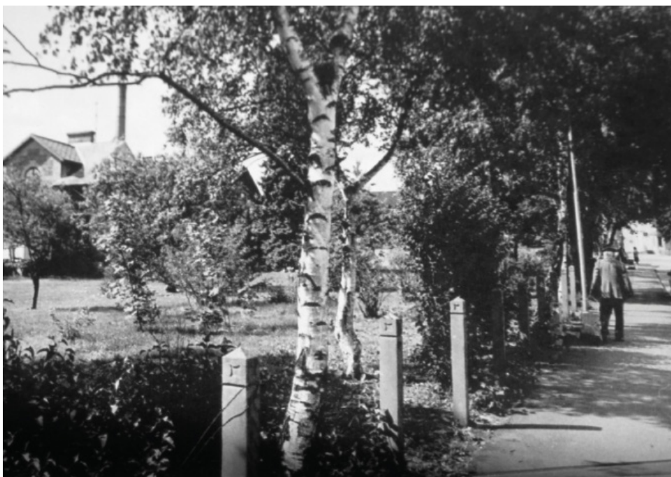
Utsikt vid mejeriet. Foto: Börje Nilsson, 1950-tal, donerat till Höors kommunarkiv.

Eleverna fick här möjlighet att reflektera över mejeriprodukternas ursprung. Var kommer egentligen mjölken, smöret, osten och grädden, som de flesta av oss konsumerar i vår vardag, ifrån? För inte alltför länge sedan fanns mejerier i nästan varje större by. Dessa mejerier spelade en avgörande roll i det dagliga livet på landsbygden, och i många byar var de den enda formen av industri. Hur ser det ut idag?