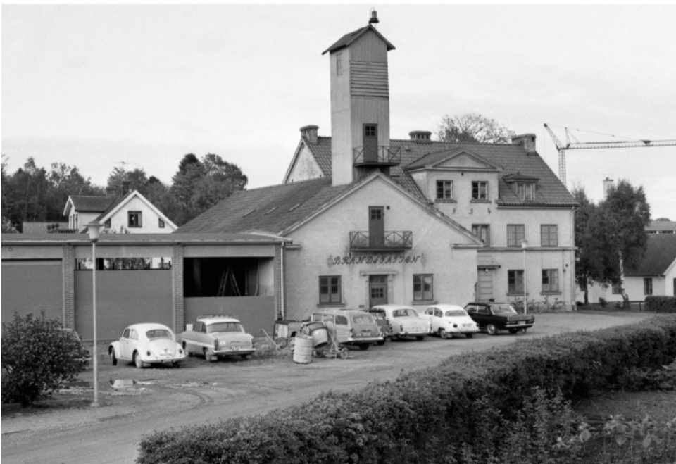
Gamla brandstationen i Höör. Foto: Börje Nilsson, 1950-tal, donerat till Höörs kommunarkiv.