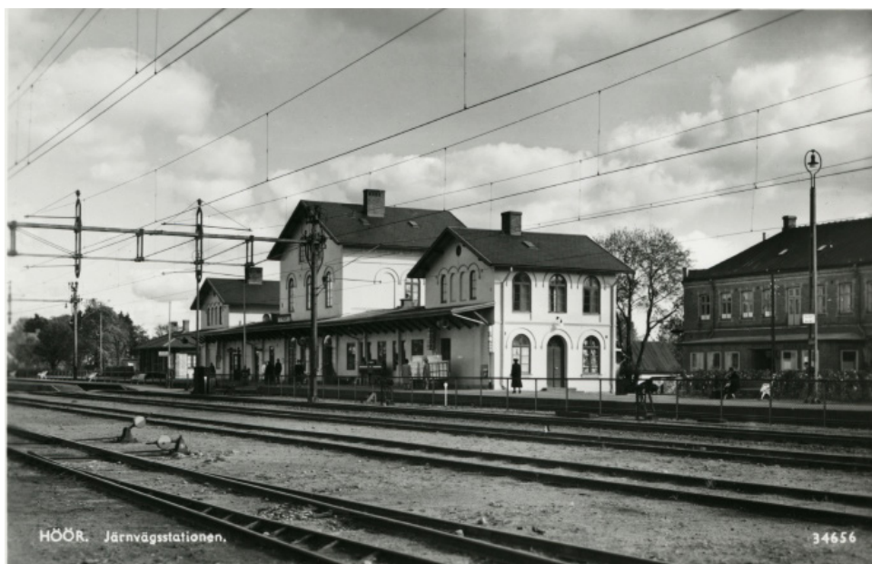
Höör järnvägsstation cirka 1938.

Eleverna fick möjlighet att fundera över hur järnvägen möjligen påverkade samhällen och de platser den passerade, och vilken betydelse den hade för människorna längs dess sträckning. De diskuterade varför enhetlig tid över hela landet var viktigt. Kanske kunde de även tänka sig situationer där olika tidszoner skulle kunna vara förvirrande?