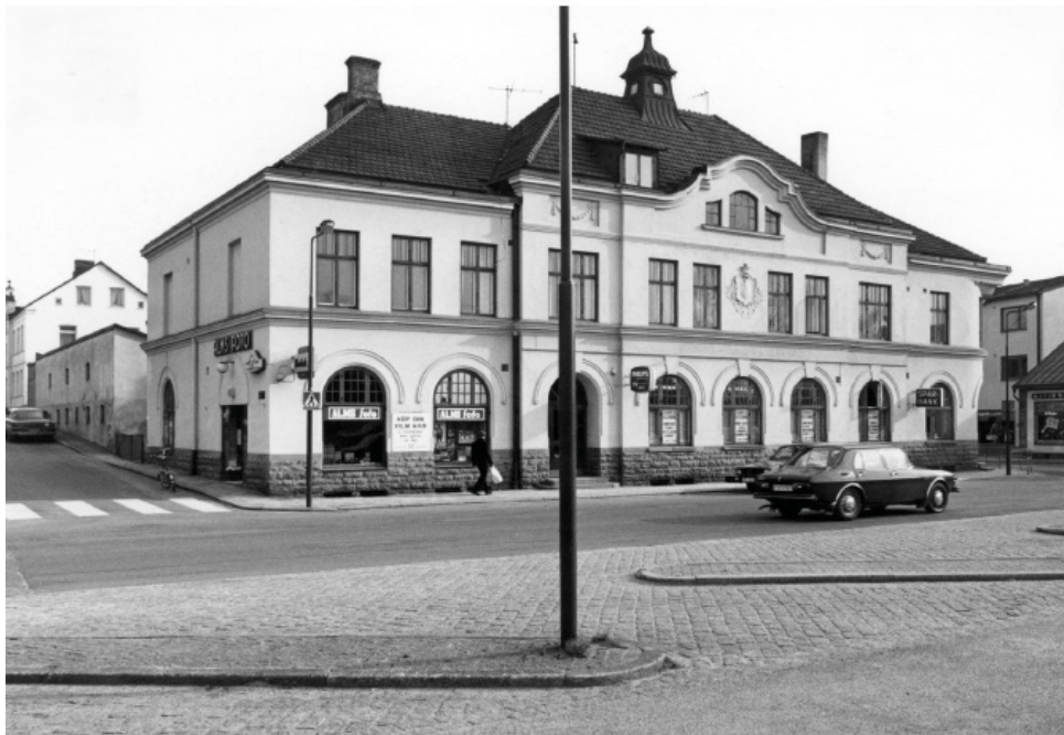
Gamla bankhuset i Höör. Byggdes 1906, revs 1983. Foto: Börje Nilsson, 1950-tal, donerat till Höörs kommunarkiv.