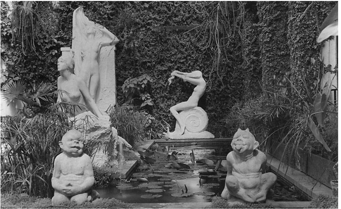
Interiörbild från Axel Ebbes Konsthall