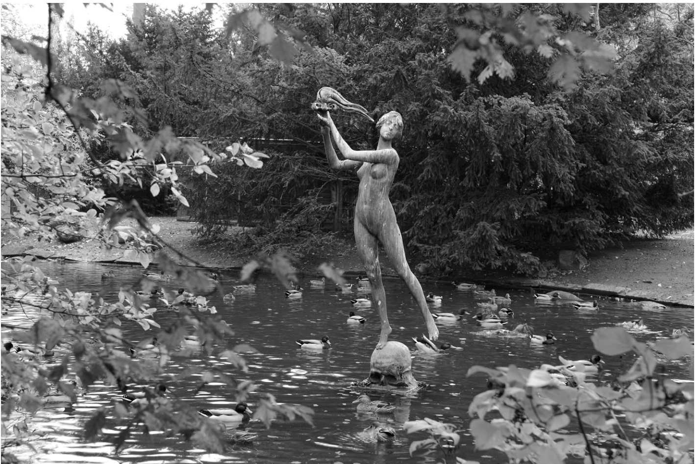
Axel Ebbe, Irrblosset , invigdes år 1919, Trelleborg