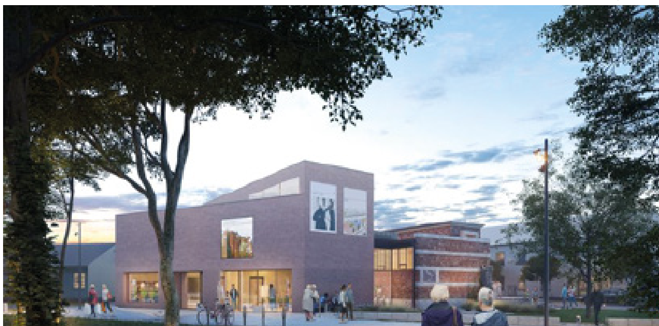
Axel Ebbes Konsthall med tillbyggnad, visionsbild Liljewalls arkitekter