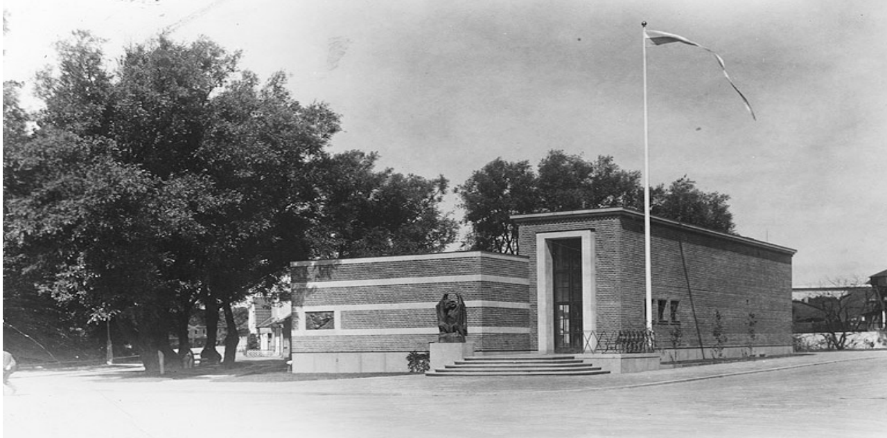
Axel Ebbes Konsthall, ritad av Carl-Axel Stoltz och invigd 1935